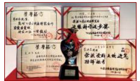
图：李洪志老师荣获 93 年健康博览会“边缘科学进步奖”和“受群众欢迎气功师”称号

到了博览会的最后一天上午，大厅里中间中西医摊位的医生，右边的卖医疗器械的人都丢下自己的摊位