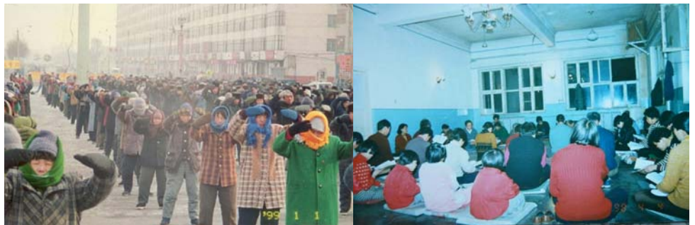
历史照片：黑龙江省双城市法轮功学员集体炼功，集体阅读法轮大法书籍

没有谁要求他们这样做，也没有谁布置他们这样做，这些贺信、贺卡和贺词都是海内外法轮功学员和明白真相的普通人自愿发出的，表达了他们对李洪志先生的感恩之情和坚修法轮大法的坚定信念。尤