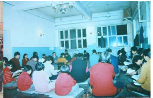
历史照片：黑龙江省双城市法轮功学员集体炼功，集体阅读法轮大法书籍

为可贵的是，在今天的中国大陆，中共对法轮功的残酷迫害仍在持续，钳制自由言论的网络封锁无处不在，每一封贺信、每一份贺卡和贺词的发出，都不可避免地承担着巨大风险、面临着重重阻扰，但即便在如此严酷的环境下，仍然有众多的法轮功学员和普通的善良人，冒着坐牢的风险，奋力突破重重难关，将他们真诚的心声发往明慧网。在当今物欲横流唯利是图的时代，还有什么比这更壮观的呢？