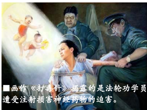
■画作《打毒针》揭露的是法轮功学员遭受注射损害神经药物的迫害。