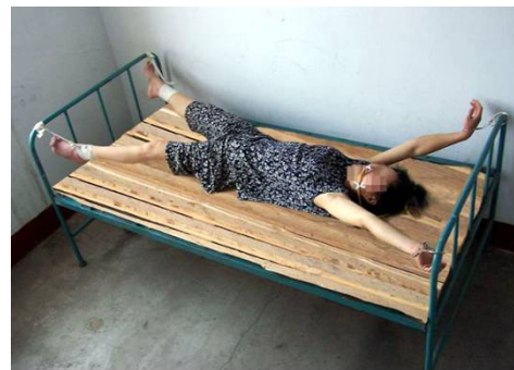
酷刑演示图——死人床

狱警除了给法轮功学员上束缚刑外,还使用更恶毒的一种酷刑,他们把中间的床板拿掉,只留两头各两块板,把手脚吊起来,上身后背垫在床板的棱上,下面小腿垫在棱上,这种酷刑每一分钟都很难熬。狱警为遮掩他们的恶行,常常在晚上实施酷刑,受刑者前半夜还清醒,后来就会被折磨得神志不清了。