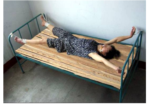
▲酷刑演示图——死人床

狱警除了给法轮功学员上束缚刑外，还使用更恶毒的一种酷刑，他们把中间的床板拿掉，只留两头各两块板，把手脚吊起来，上身后背垫在床板的棱上，下面小腿垫在棱上，这种酷刑每一分钟都很难熬。狱警为遮掩他们的恶行，常常在晚上实施酷刑，受刑者前半夜还清醒，后来就会被折磨得神志不清了。