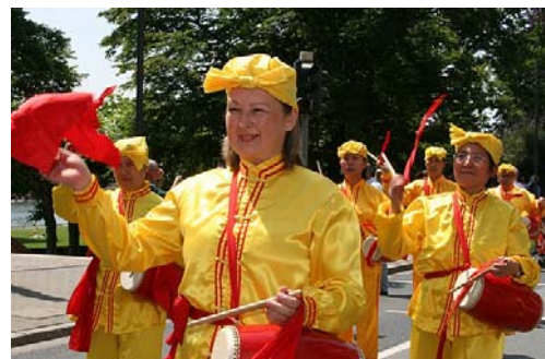
德国法轮功学员组成的腰鼓队

不少观众表示，以前曾听说过法轮功，今天更深地感受到法轮功学员的善良正义，更详细地了解到这场迫害的残酷，同时也增添了对法轮功和其修炼者们的敬意。