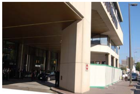
图：中共党魁 G20 峰会期间住在威斯汀酒店。该酒店正门被新建的约8英尺高的白色木墙封住，以便在酒店门口上下车的中方代表看不见抗议人群。

围墙和留学生打出的红旗据说能让中共党魁看不见法轮功学员的横幅，取消记者会是为了逃避关于法轮功学员受中共迫害真相的提问。