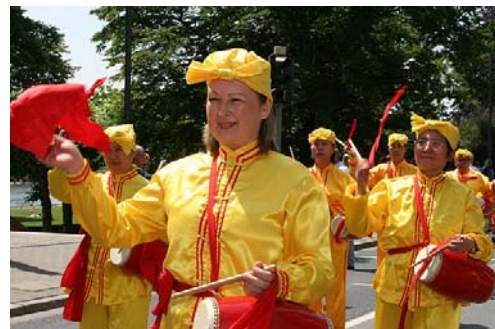
德国法轮功学员组成的腰鼓队

不少观众表示，以前曾听说过法轮功，今天更深地感受到法轮功学员的善良正义，更详细地了解到这场迫害的残酷，同时也增添了对法轮功和其修炼者们的敬意。◇