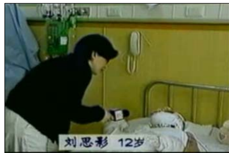
“自焚”中气管被切开能唱歌