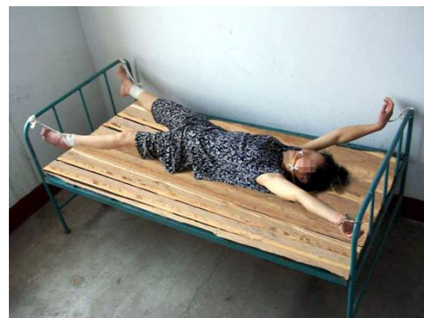
酷刑演示图——死人床

狱警除了给法轮功学员上束缚刑外，还使用更恶毒的一种酷刑，他们把中间的床板拿掉，只留两头各两块板，把手脚吊起来，上身后背垫在床板的棱上，下面小腿垫在棱上，这种酷刑每一分钟都很难熬。狱警为遮掩他们的恶行，常常在晚上实施酷刑，受刑者前半夜还清醒，后来就会被折磨得神志不清了。