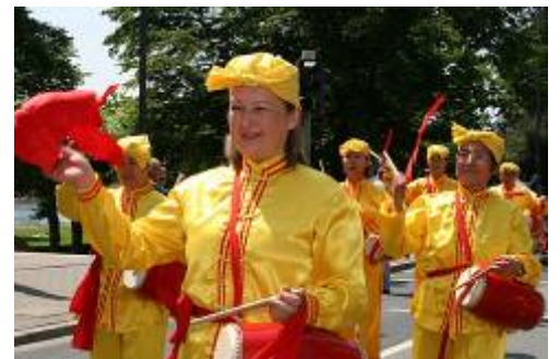
德国法轮功学员组成的腰鼓队

不少观众表示，以前曾听说过法轮功，今天更深地感受到法轮功学员的善良正义，更详细地了解到这场迫害的残酷，同时也增添了对法轮功和其修炼者们的敬意。◇