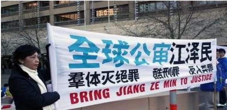
■ 法庭外声援诉江案的法轮功学员

《九评共产党》一书真实深刻地揭露了中共的邪恶本质，截至 2010 年 7 月 15 日止，已有超过 7690 万中国民众在海外大纪元网站声明退出中共党、团、队。天灭中共，退党退团退队保命。