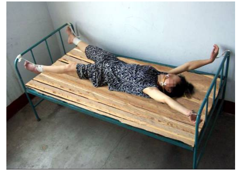
酷刑演示图——死人床

为加重折磨法轮功学员,狱警有时会把床板全拿掉,强行把法轮功学员的双脚固定住,使受害者坐在细细的床栏杆上,整整一个晚上,把人放下时,受害者通常都不会动了,两条腿全都肿了。