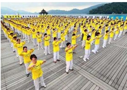
图为台湾法轮功学员在伊达邵码头炼功

大陆游客到台必游的景点日月潭，二零一零年七月十七日除了满满的游客，更聚集了来自台湾中部地区的一千多位法轮功学员，为悼念十一年来被中共迫害致死的三千多位同修，并希望唤起更多人关注，共同制止中共迫害法轮功。