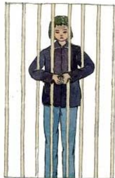
示意图：拇指铐酷刑