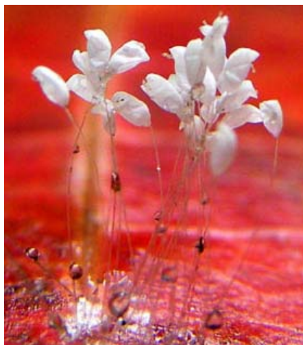
图：枫叶上圣洁的花（辽宁，2009）