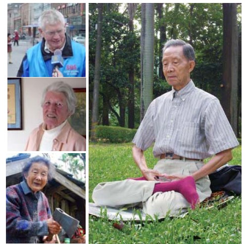
图左上：鲍尔接受采访；左中：95岁的汉娜；左下：92岁的阿嬷拿斧头劈柴；右图：99岁的马济宇晨炼

台湾阿里山山区、嘉义县竹崎乡“顶笨仔”聚落，有位九十二岁的老阿嬷，因为炼法轮功，长年驼背的腰挺直了，而且还能举斧头劈柴，（接下页）