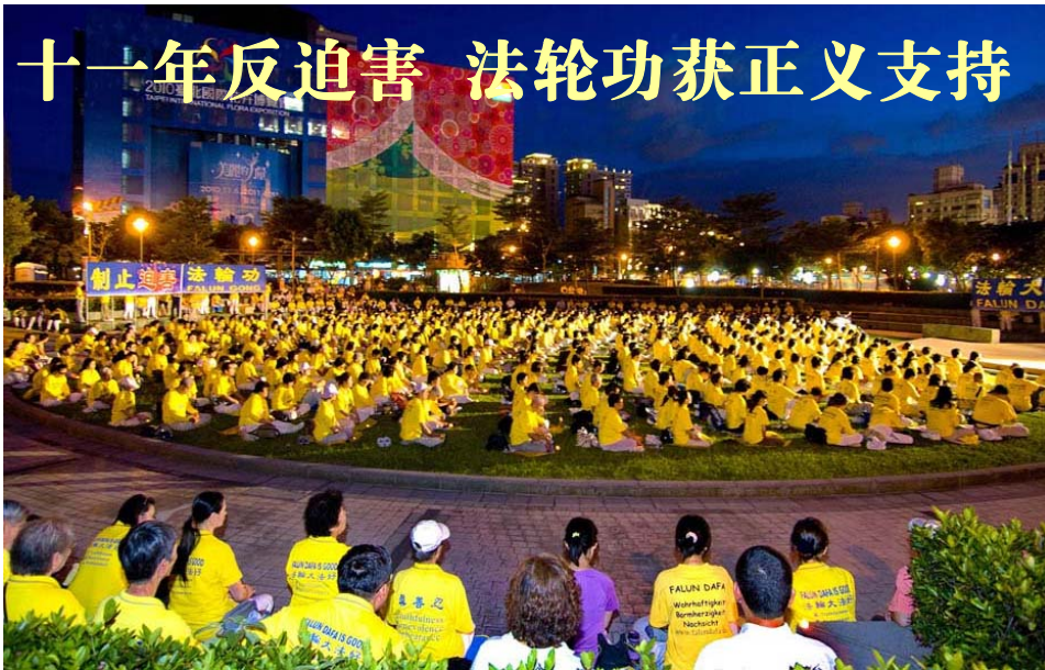
图：二零一零年七月十八日，台湾北区上千名法轮功学员在台北信义广场举办“彰显正义良知、制止中共血腥迫害”的活动。

（明慧记者容法比利时报导）法轮功学员反迫害十一年之际，欧、美、亚、澳的各国法轮功学员们纷纷举行集会游行等活动，呼吁制止中共的迫害，呼唤良知。