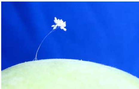
美国纽约州绽放的优昙婆罗花

“藏字石”，巨石断面内惊现六个排列整齐的大字“中国共产党亡”。经专家考察，一致认为：掌布河谷景区“藏字石”上的字位于距今二亿七千万年左右的二叠统栖霞组深灰色岩中。在“藏字石”上至今未发现人工雕凿及其它人为加工痕迹。对此，《人民日报》、中央电视台等一百多家报纸、电视、网站作了报道，但报道只说“中国共产党”五个字，而绝口不提最后一个最大的“亡”字。