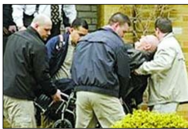
2009年4月14日美移民官员将戴姆扬尤克从俄亥俄州的家中带走