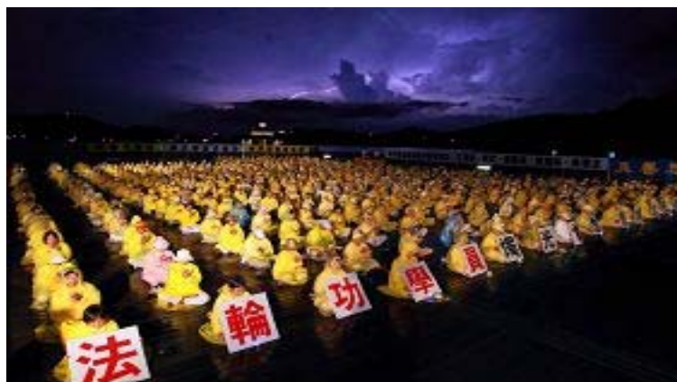
■ 七月十七日台湾中区部份法轮功学员在日月潭举办“七二零烛光悼念会活动”，悼念在中国被中共迫害致死的同修