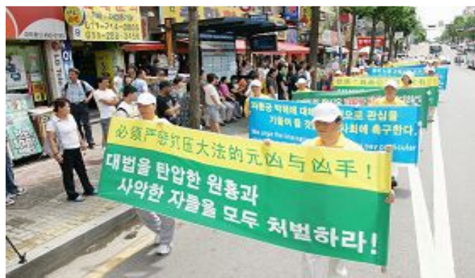
■ 七月十八日，韩国法轮功学员举行“七二零法轮功反迫害十一年”联合集会游行。呼吁制止迫害，严惩元凶，并向各界民众释出明确信息：“解体中共才能制止迫害”、“必须严惩打压大法的元凶”、“全球公审江泽民”