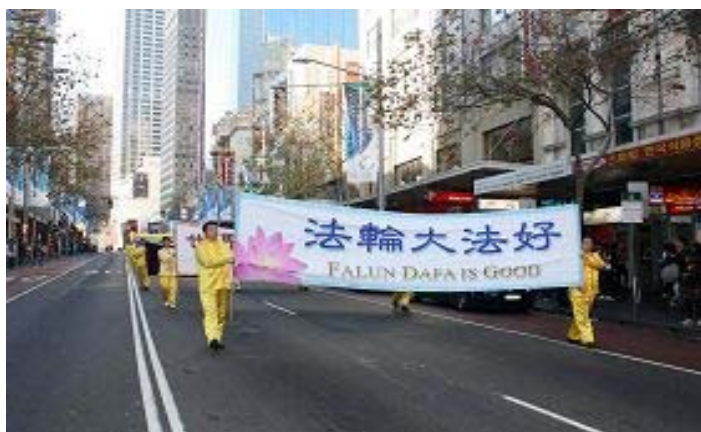
■ 七月十七日法轮功学员在悉尼举行反迫害大游行，展示大法弘传世界、大法的神圣美好。揭露中共活摘法轮功学员器官的累累罪行