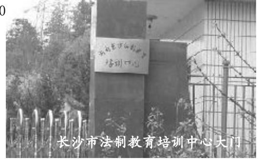
长沙市法制教育培训中心大门

二十一世纪的今天，中共洗脑班的依然存在，是对中国司法的亵渎，是对民众人权的践踏。这种文明社会的耻辱与毒瘤势必被历史所唾弃与贬伐，也到了彻底扫除之时了！◇