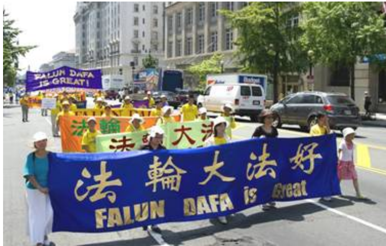
■ 二零一零年七月二十三日，法轮功学员在华盛顿 DC 举行反迫害大游行

回顾十一年反迫害的路，此次法轮功反迫害活动协调人之一的向东先生感慨道，“九九年七月，得悉中共开始公开迫害法轮功的消息，很多同修第一时间自发赶到这里，因为这里是一个自由国家的首都，也是中国驻美大使馆所