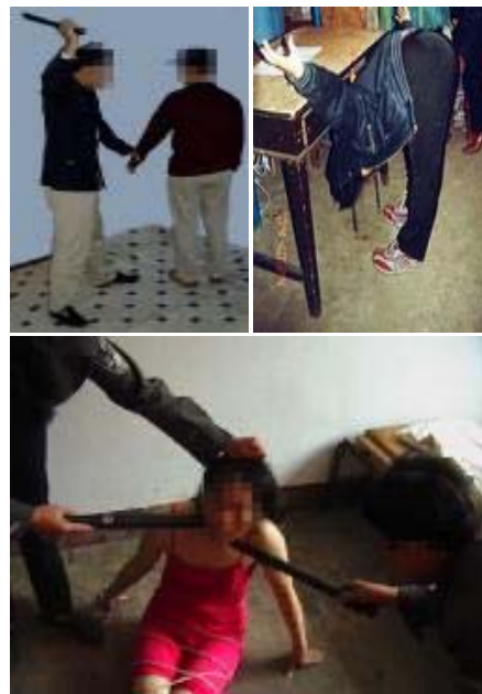
▲ 辽宁省女子监狱酷刑演示: 上左图/胶皮棒打 上右图/撅着 下图/多根电棍电击

以上事实没有一丝夸张,因了解能力及其他方面因素所限,真实的情况超过这不知多少倍。这就是中共制下的现代化“文明”监狱——辽宁省女子监狱八监区。◇