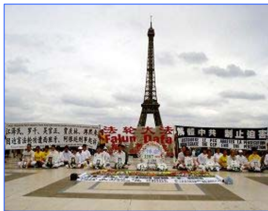
■法国法轮功学员在巴黎的人权广场抗议中共迫害

都来到人权广场，摆放真相展板，炼功、发真相资料和光盘，讲述中国大陆法轮功学员如何以大善、大忍的胸怀面对中共邪恶疯狂的迫害。这群修炼真、善、忍的人们在中国被非法劳教、判刑、酷刑折磨，甚至被活体摘取器官。中共的行为应遭天谴。了解了真相的人们纷纷在请愿书上签字，表示对法轮功的支持。◇