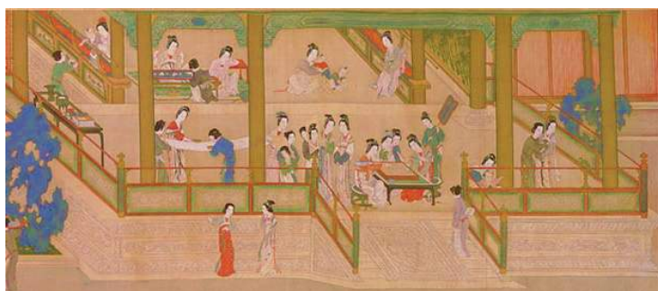
图：中国古代棋风盛行

人生如棋，棋亦如人生，人可以不下棋，但不能不走人生的棋。因为人一出生就在棋中，棋一盘结束可以再来一盘，而人一生的棋局只有一盘，落子不悔，人生岂可走回头路？围棋的道理给人以启示：看清全盘，目光高远，找到自己的因缘，找到通向美好未来的光明大道，认真走好每一步，才会有完美的结局。（文/智真）◇