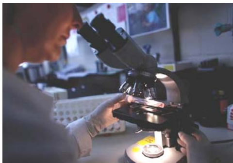
图：科学家们在显微镜下观察病毒对进化论构成挑战。