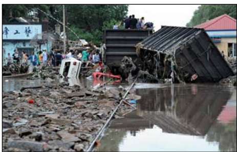
图：7月28日吉林永吉县河水暴涨造成永吉县全城被水淹没，城中水深一度达到5米多，火车车厢被冲上大街。

而居住在朝阳水库最近的朝阳四队（离河边大约200米左右），地势最低，按常理这个队是最危险的。当时，通讯全部中断。外边的人都以为这个队也同样遇难了。结果大水过后，只有村口东边