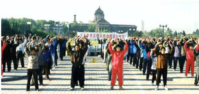
图：1998年长春法轮功学员集体炼功

1999年7月20日，中共发动了对法轮功的全面迫害，引发全球法轮功学员反迫害、讲真相活动。事实证明，这场迫害不仅针对法轮功学员的“真善忍”信仰，也在试图泯灭所有人的道德原则和精神价值。