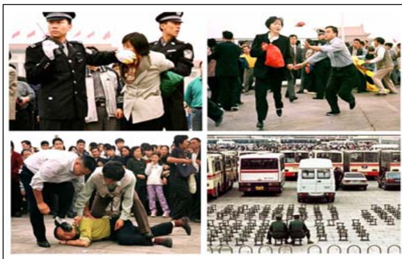
图：天安门广场上暴力绑架法轮功学员

在长达半个多世纪的历史中，中共每隔一段时间就要发动一次运动，针对某个特定的中国民众群体进行大规模迫害，如：三反、五反、镇反、肃反、反右、文革、六四……。法轮功讲“真善忍”，共产党讲“假恶斗”。法轮功象乱世中的清流，在短短几年间引来上亿人修炼。这是中共不能容忍的所谓“和党争夺民心”，使对权力极度偏执的中共江泽民集团本能地妒忌和恐惧，于 1999 年 7 月发动了对法轮功的全面迫害。