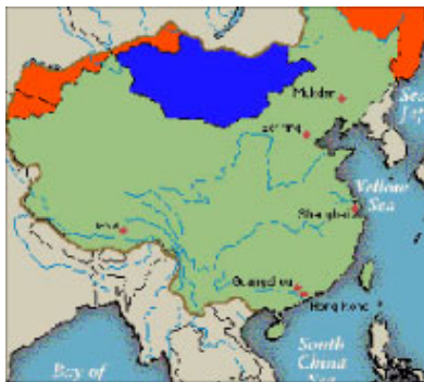
■ 橙色部份为江泽民出卖中国的土地范围

共产党在攫取政权之后，为了权力的“稳定”，为了拉拢人心称霸一方，曾经多次割让国土给周边的小国，包括巴基斯坦、缅甸、尼泊尔、北朝鲜、越南、印度，等等；