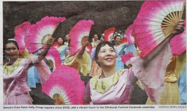
Fan fare: Chinese light up Cavalcade