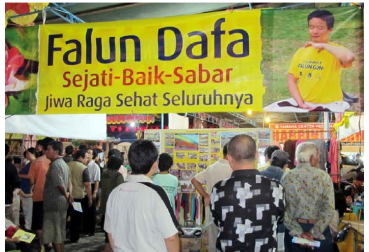
■ 民众在展板前了解法轮功真相

（明慧记者印尼报道）为纪念郑和下西洋六百零五周年，二零一零年八月五日至七日，印尼中爪哇三宝龙地区举办了一年一度的传统纪念活动。法轮功学员设立展位参加活动，受到民众的热烈欢迎。