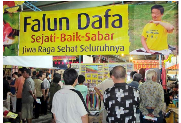
■ 民众在展板前了解法轮功真相

（明慧记者印尼报道）为纪念郑和下西洋六百零五周年，二零一零年八月五日至七日，印尼中爪哇三宝龙地区举办了一年一度的传统纪念活动。法轮功学员设立展位参加活动，受到民众的热烈欢迎。