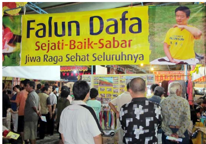
■ 民众在展板前了解法轮功真相

（明慧记者印尼报道）为纪念郑和下西洋六百零五周年，二零一零年八月五日至七日，印尼中爪哇三宝龙地区举办了一年一度的传统纪念活动。法轮功学员设立展位参加活动，受到民众的热烈欢迎。