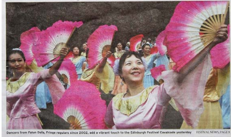
Fan fare: Chinese light up Cavalcade