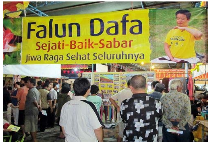
■ 民众在展板前了解法轮功真相

（明慧记者印尼报道）为纪念郑和下西洋六百零五周年，二零一零年八月五日至七日，印尼中爪哇三宝龙地区举办了一年一度的传统纪念活动。法轮功学员设立展位参加活动，受到民众的热烈欢迎。