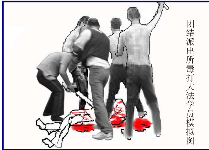
团结派出所毒打大法学员模拟图