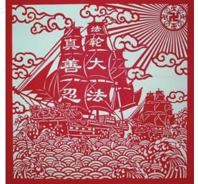
사부님께서 이끄시는 법선

미국 국가발레 예술가 컨·월스(왼 쪽 사진)는 《신운은 절대적으로 세계에서 제일이다. 그 어떤 예술단체나 예술표현형식은 신운과 아름다움을 비할 수 없다. 신운은 중국의 진정한 전통적 문화예술을 표현했으며 대단히 전통적이다.》라고 찬양했다.