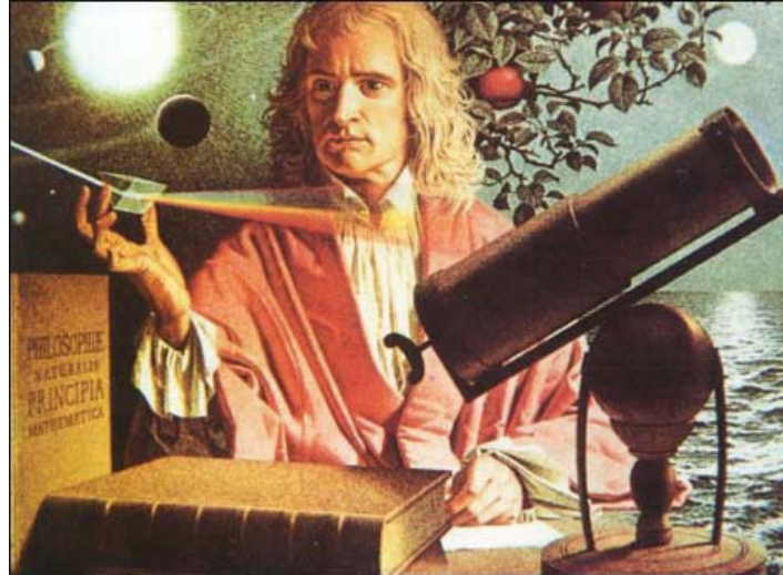
과학의 거장 뉴턴은 만물존재의 배후에 한 지혜가 큰 만능의 신이 있다고 굳게 믿었다.