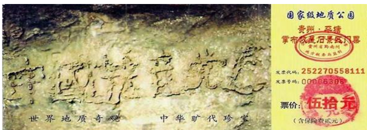
左图为贵州平塘县“藏字石”风景区的门票，“中国共产党亡”六个大字清晰可见。

* 利用出国的机会，将“三退”名单在国外通过上述方式发出或者交给退党服务中心工作人员。