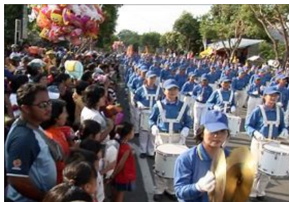
被天国乐团吸引的印尼民众

二零一零年八月十八日下午三时，骄阳似火，一支浩大、靓丽的游行方队出现在印尼旅游胜地峇厘岛星格拉贾的国庆日游行队伍里，吸引当地民众以及来自世界各地游客的驻足观看。这支游行方队由法轮功学员组成，受邀参加印尼国庆六十五周年的庆祝活动。