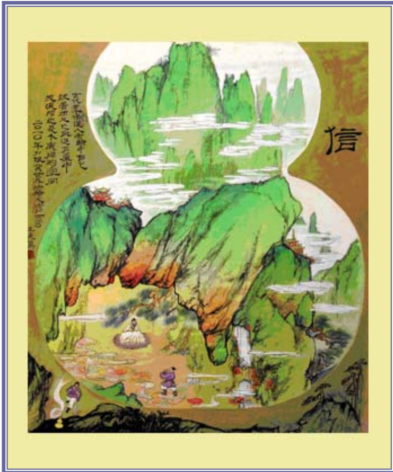
国画《葫芦里的世界》 二零一零年法轮大法日征稿选登