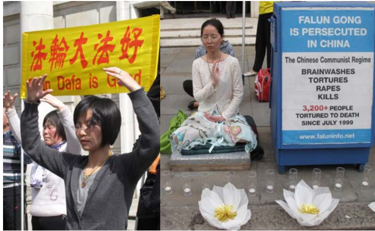
■ 伦敦中使馆前，法輪功学员每天二十四小时反迫害抗议持续八年多了