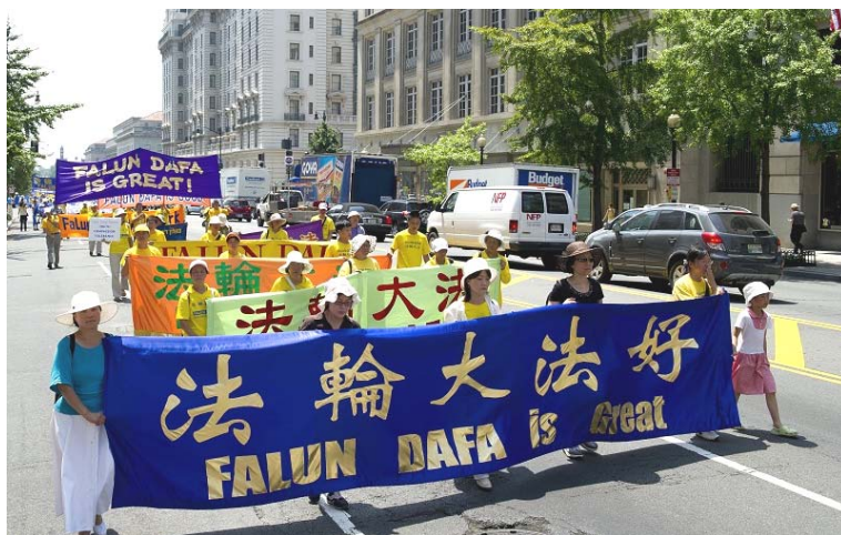
■二零一零年七月二十三日，法轮功学员在华盛顿 DC 举行反迫害大游行