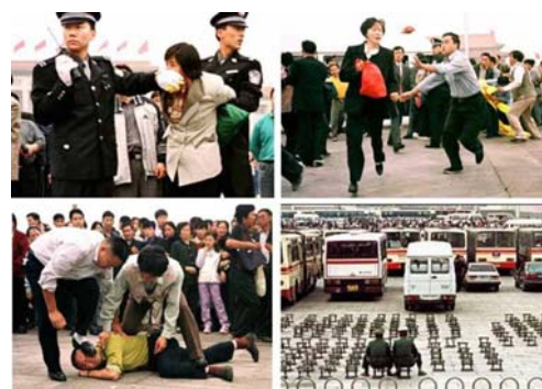
图：九九年“七二零”迫害之后，天安门广场上警察对法轮功学员施暴。

如果说，十一年之中，因为中共的欺骗，你曾经误解或是被动地无知地参与了诬陷、迫害法轮功，那么今天，在你还有机会对自己所做的一切悔悟、弥补的时候，那就请珍惜这样的机会吧！不要给自己的生命留下遗憾！