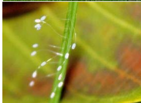
新加坡法轮功学员在东海岸公园集体炼功。图中左上方为学员们在草坪上炼功，右下方为优昙婆罗花绽放的特写。

炼功活动在傍晚六点十分结束后，学员们在炼功场草坪中多处发现了绽放的优昙婆罗花。据佛经中说，优昙婆罗花三千年一开，花开之时为转轮圣王下世正法度人之时。从世界各地的相关报导可以看到，近几年来，无论是铜像、钢铁、玻璃，还是塑胶、水果、植物等等，也无论寒暑、无论寺院还是寻常百姓家，都留下了此一奇花的踪迹。