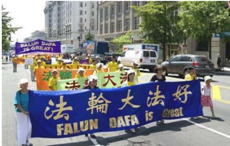
■ 二零一零年七月二十三日，法轮功学员在华盛顿 DC 举行反迫害大游行

回顾十一年反迫害的路，此次法轮功反迫害活动协调人之一的向东先生感慨道，“九九年七月，得悉中共开始公开迫害法轮功的消息，很多同修第一时间自发赶到这里，因为这里是一个自由国家的首都，也是中国驻美大使馆所