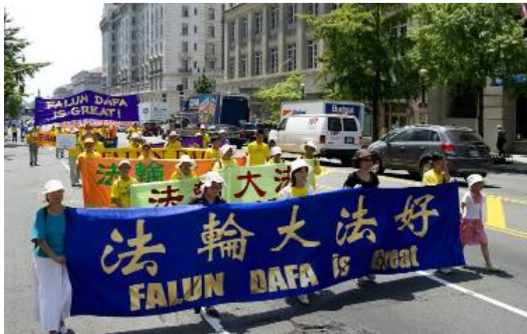
■ 二零一零年七月二十三日, 法轮功学员在华盛顿 DC 举行反迫害大游行

人甚至被活体摘取器官, 但法轮功学员从未退缩, 也没有一个诉诸暴力, 始终和平理性地抵制迫害。这可说是当今社会的一个奇迹。