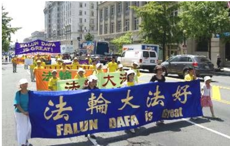
■ 二零一零年七月二十三日, 法轮功学员在华盛顿 DC 举行反迫害大游行