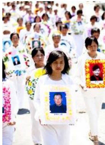
■ 游行中“悼念被中共迫害致死的法轮功学员”方阵