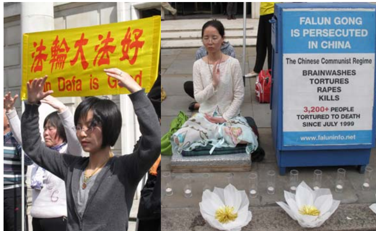
■ 伦敦中使馆前, 法輪功学员每天二十四小时反迫害抗议持续八年多了