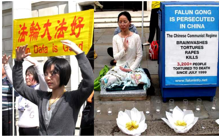
■ 伦敦中使馆前，法輪功学员每天二十四小时反迫害抗议持续八年多了