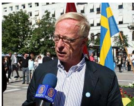
欧盟议员霍克马尔科在演讲后接受采访

了对共产独裁和纳粹所犯罪行的谴责。瑞典法轮功学员受主办方的邀请也参加了集会，并向在场的国会议员及来宾发放英文、瑞典文的《九评共产党》以及法轮功真相资料，揭露中共对法轮功的迫害以及活摘法轮功学员器官的残暴行径。