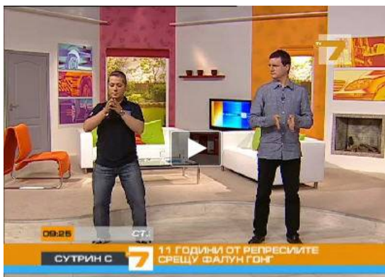
图：保加利亚西人法轮功学员（左）为主持人和观众演示功法

二零一零年七月二十日，在法轮功学员反迫害十一周年之际，保加利亚国家电视 7 台的早间节目特邀两位西人法轮功学员介绍法轮功。在现场直播的节目中，法轮功学员为主持人和观众示范了法轮功功法。在节目的最后，两位法轮功学员将象征希望的手工莲花作为礼物送给两位主持人，他们呼吁制止迫害法轮功。