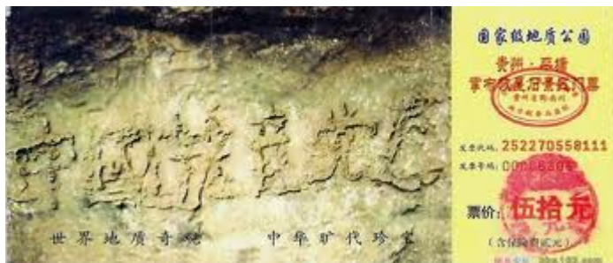
■ 贵州平塘二点七亿年藏字石

非典雪灾禽流感， 水旱地震泥石流。 病毒变种季节乱， 天灾频繁有因由。 佛法被诬在人间， 大法弟子冤狱囚。 自古奇冤伴大灾， 人不醒悟祸临头。