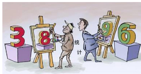
■ 漫画：统计数据造假

这不是在说明“资本主义比社会主义好”、“没有共产党中国才会更好”吗？（文／一片石）◇