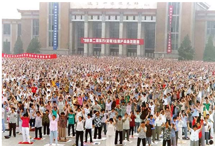
■1998 年 5 月，辽宁省沈阳市法轮功学员集体大炼功

我是一名普通青年，刚刚走出学校的大门。学校的教育使我从未怀疑过电视等媒体和教科书中对法轮功的宣传会是假造的；我也不知道法轮功到底是怎么回事。但一件事让我了解并感受到了法轮功的美好。