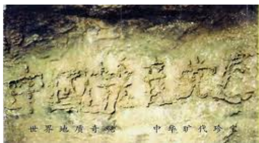
■ 贵州平塘二点七亿年藏字石

非典雪灾禽流感， 水旱地震泥石流。 病毒变种季节乱， 天灾频繁有因由。 佛法被诬在人间， 大法弟子冤狱囚。 自古奇冤伴大灾， 人不醒悟祸临头。