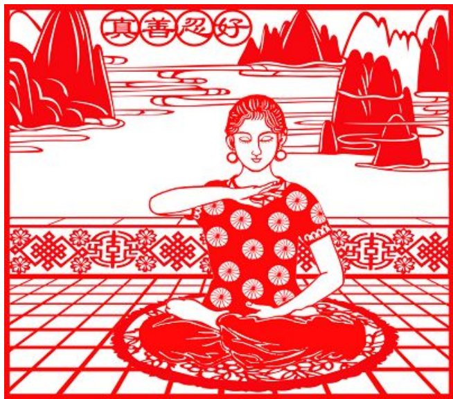
▲上图是法轮功学员创作的剪纸作品

【明慧网】前天上午我到集市上去，见一个三十多岁的妇女在摆地摊卖香瓜。我走过去一边看瓜一边讲真相。谁知这妇女为中共谎言所迷，态度冷淡不愿搭腔。我问她小时读书时戴过红领巾没有？这妇女一口回绝道：“我学都没有