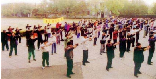
■ 迫害前，清华大学的法轮功学员在清华学堂前炼功。