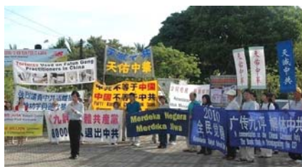
图为：马来西亚民众声援 8000 万中国民众三退集会现场。