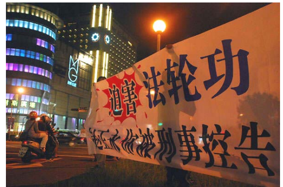
图为：二零一零年九月十三日抵台的陕西代省长赵正永十六日落脚嘉义市耐斯饭店时，晚上七点起，法轮功学员就在嘉义市耐斯饭店外面拉起横幅：“迫害法轮功 赵正永你被刑事控告了”、“制止迫害法轮功”等文字。