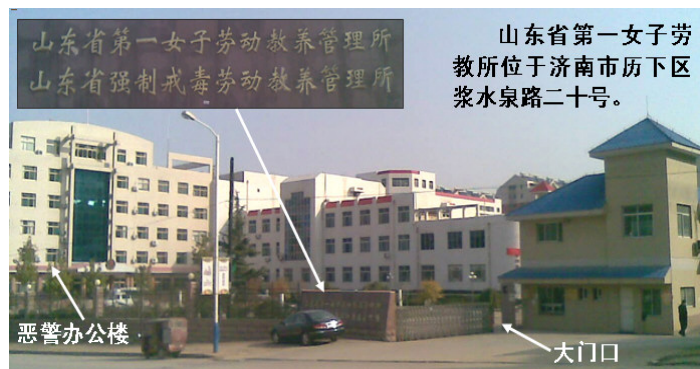
山东省第一女子劳动教养管理所 山东省强制戒毒劳动教养管理所

山东省第一女子劳教所（也称济南浆水泉女子劳教所）位于济南市历下区浆水泉路二十号，是残害山东女法轮功学员的黑窝。