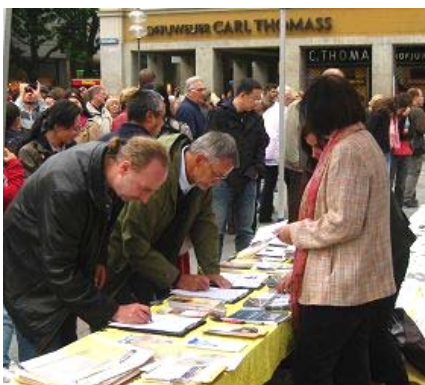
■人们纷纷签字谴责中共暴行

【明慧网】二零一零年九月十八日，在德国慕尼黑市中心玛丽亚广场上举行了声援八千万中国人退出共产党、共青团、少先队的活动。因为这一天也是慕尼黑啤酒节的第一天，所以许多中国人慕名前来。他们中很多都接受了揭露中共邪恶本质的《九评共产党》报纸，有的当场就退党、退团。还有的中国人表示：“我支持你们！”