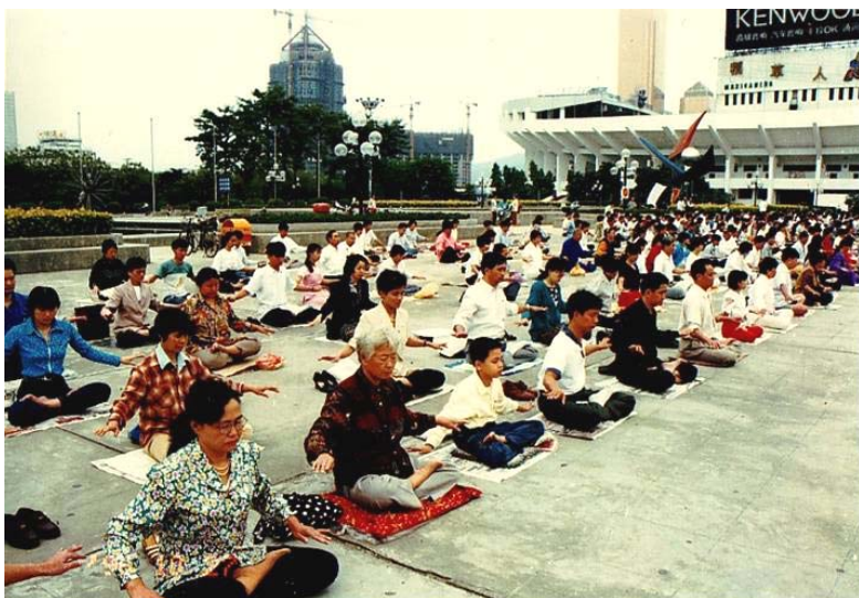
图：1996年10月27日，广州法轮功学员集体炼功。

1992年5月法轮功从长春公开传出。1993年4月到1994年12月，李洪志师父先后在广州举办了五期法轮功学习班，共有8000多人聆听讲法。