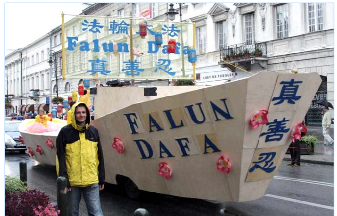
图：法轮功学员的船型彩车驶进民众视线

法轮功学员说：“不是中国人说不好，而是一开始就有上亿中国人说法轮功太好了并坚持修炼。中共和江泽民恐慌，害怕越来越多的中国人遵循‘真、善、忍’，就不容易被它们的谎言和暴力所操控了。于是江泽民和中共勾结，开始了长达十一年的残酷迫害。”法轮功学员拿起话筒向民众讲述了中共自编自演的“自焚”等真相，波兰小伙子要了全部真相资料，他说：我一定把真相告诉我所有的中国朋友，迫害一定要停