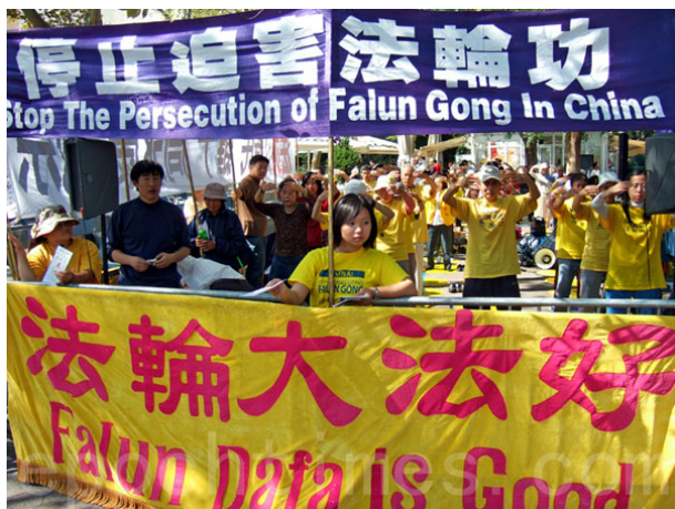
■九月二十二日, 联合国前的广场上, 大纽约地区法轮功学员吁停止迫害法轮功

联合国千年发展目标高级别会议和第六十五届联大一般性辩论于二零一零年九月二十日在纽约开幕。二十一至二十三日连续三天, 部份大纽约地区法轮功学员聚集在各国首脑, 包括中共总理温家宝入住的华尔道夫酒店外, 呼吁制止中共