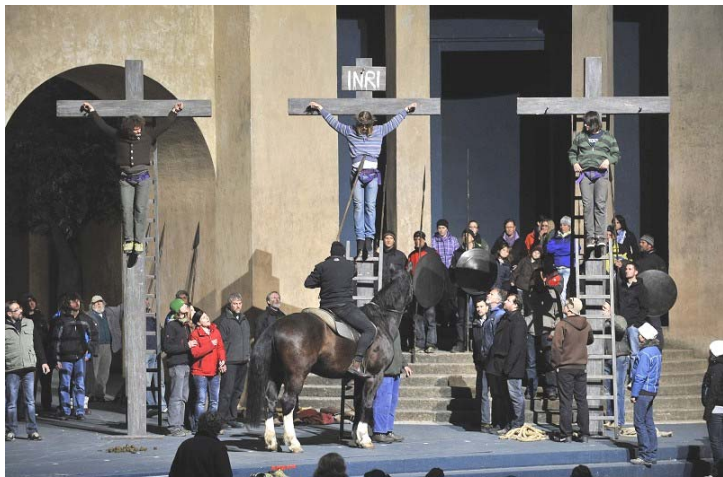
排练《耶稣受难剧》场景

乘着淡淡的暖意，掠过轻巧的树影，染红了几片叶子，方才知秋天来了，而这秋韵，正温馨恬静地悠扬着蓝天下飘逸的白云。