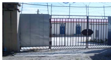
原昌黎县洗脑班,先后在此受到非法关押迫害的有几百名法轮功学员。新建筑物,现关押上访人员。