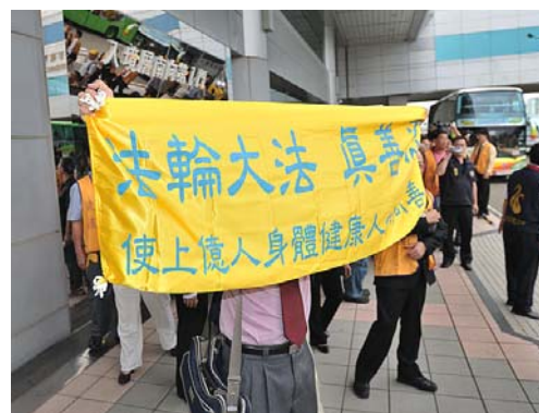
图为: 台湾一位法轮功学员在机场的武汉团的车子的正前方, 将“法轮大法真善忍使上亿人身健康人心向善”的横幅拉开。

左图为湖北省“六一零组织”头子杨松九月二十日下午搭机抵达台湾桃园国际机场即接到法轮功学员控告杨松违犯“残害人群罪”的诉状, 快递到他手中。